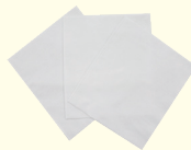
10. 拭き取りシート 3枚