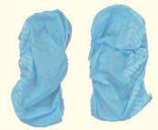
4. シューズカバー 1組