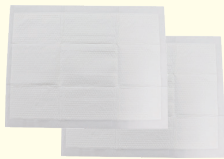
9. 吸水シート 2枚