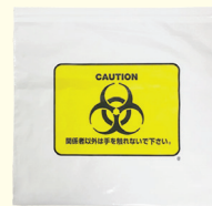
11. ケモジッパー(大) 1枚