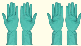
2. ニトリルグローブ 2双